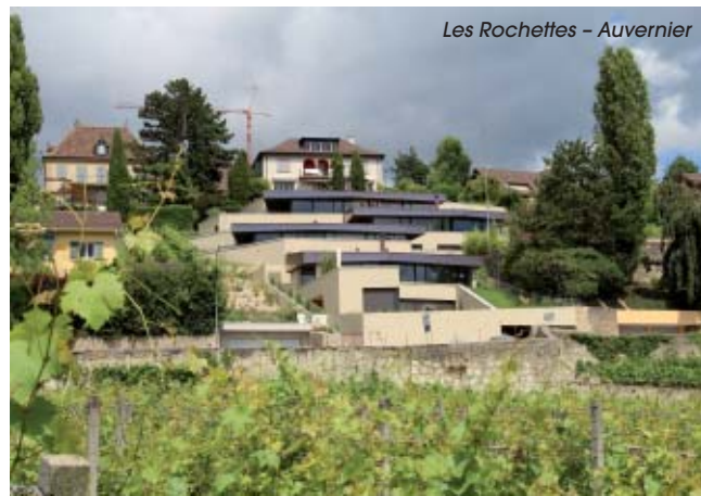
Les Rochettes – Auvergnier