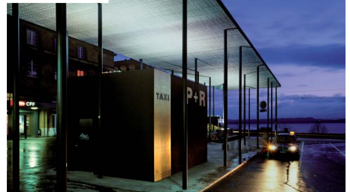
Couvert de la gare CFF – Neuchâtel

En effet, chaque réalisation du bureau GD architectes a son expression propre. Un point commun les relie: une architecture intégrée, calme et pérenne.