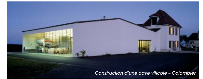
Construction d'une cave viticole – Colombier