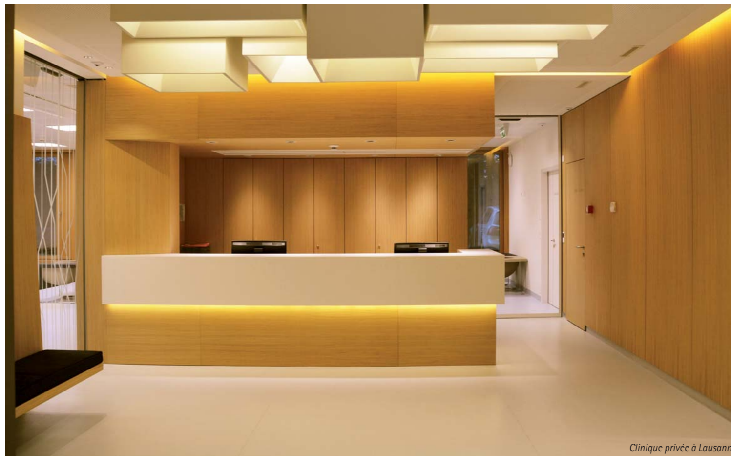
Clinique privée à Lausanne

Les Carneiro se limitent à choisir deux matériaux, voire, plus rarement, trois, pour rehausser les contrastes. Toujours selon leur inclination pour l'harmonie, ce minimalisme dans les matières leur permet de sélectionner «ce que l'on souhaite mettre en valeur». L'immeuble de la rue des Moraines à Carouge présente un vibrato de beige sable sur les deux niveaux inférieurs et de noir sur le dernier niveau, embelli dans son horizontalité.