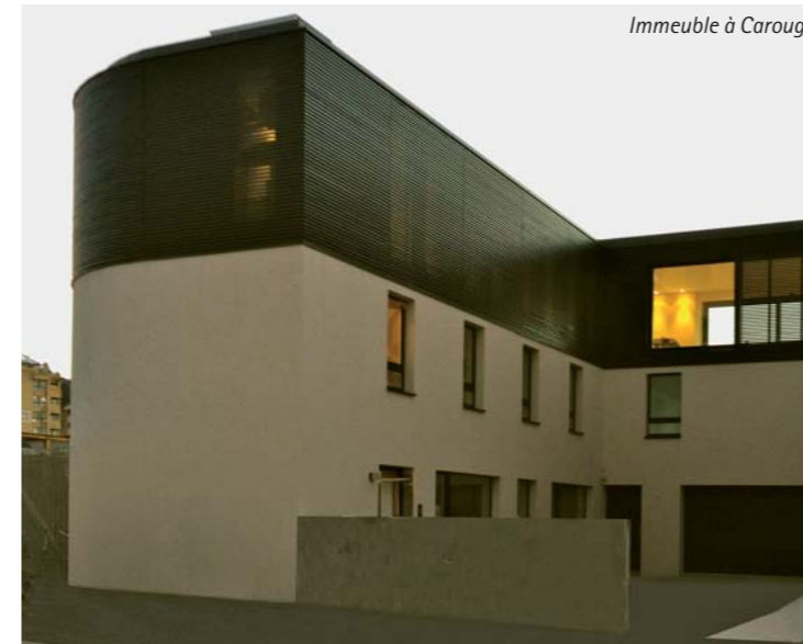
Immeuble à Carouge

Et cela vaut autant pour l'enveloppe d'une construction que pour l'aménagement intérieur des espaces. Car le bureau Carneiro, composé de 8 architectes dont un d'intérieur, configure aussi des éléments de construction qui assurent une fonction de mobilier, comme une bibliothèque-mur, un îlot central de cuisine de restaurant ou encore des placards étudiés dans les moindres détails. «Nous aimons aussi travailler les intérieurs, de façon uniforme et en harmonie avec l'ensemble. Un élément central et des matières éteintes autour.