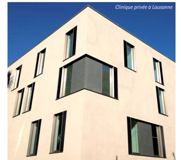
Clinique privée à Lausanne