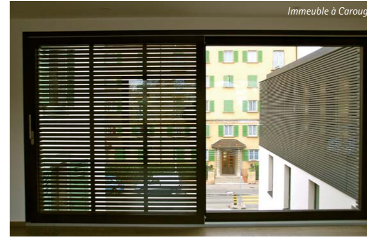
Immeuble à Carouge