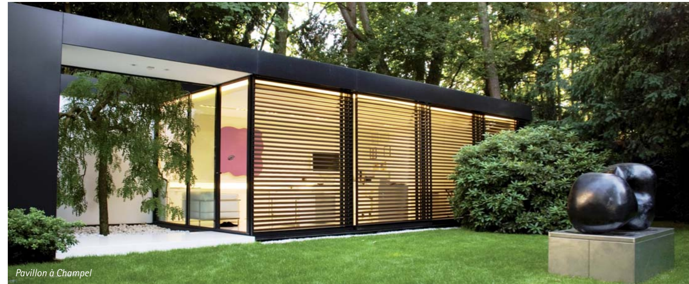
Pavillon à Champel