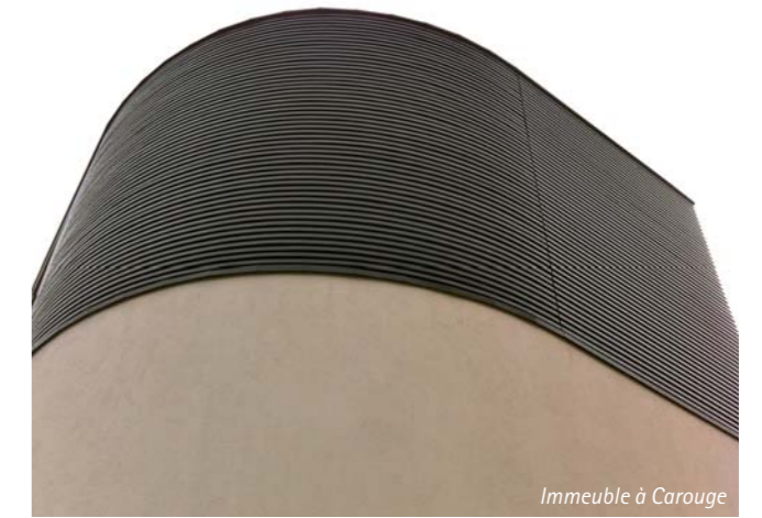
Immeuble à Carouge