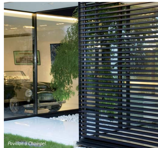
Pavillon à Champel

Le dessin comme traduction graphique de l'idée Ils parviennent à cette architecture de haute facture en pensant et en dessinant tout. «Nous dessinons beaucoup plus que la moyenne afin de contrôler les détails et la finition et aussi pour que le concept et l'idée de base ne se diluent pas au fil de l'avancement du projet. Si pour les portes de placards nous avons choisi des lignes de main et non des poignées, nous les dessinons.»