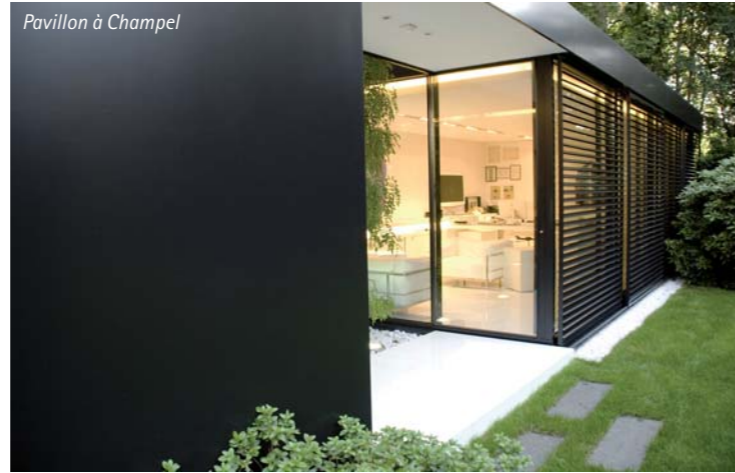
Pavillon à Champel