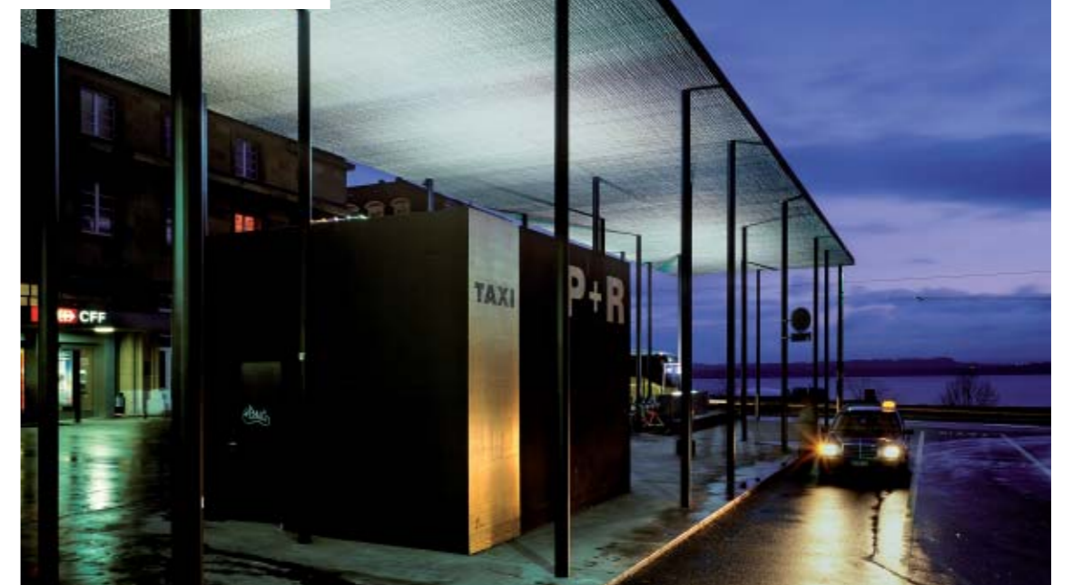
Couvert de la gare CFF – Neuchâtel

En effet, chaque réalisation du bureau GD architectes a son expression propre. Un point commun les relie: une architecture intégrée, calme et pérenne.