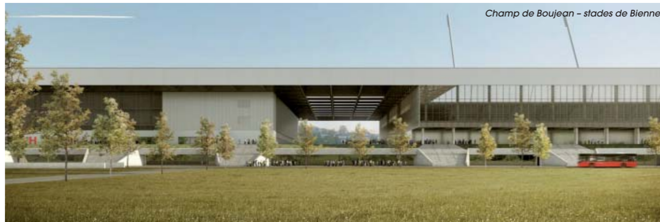
Champ de Boujean – stades de Bienne