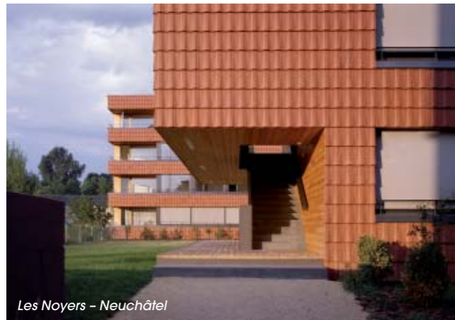
Les Noyers – Neuchâtel