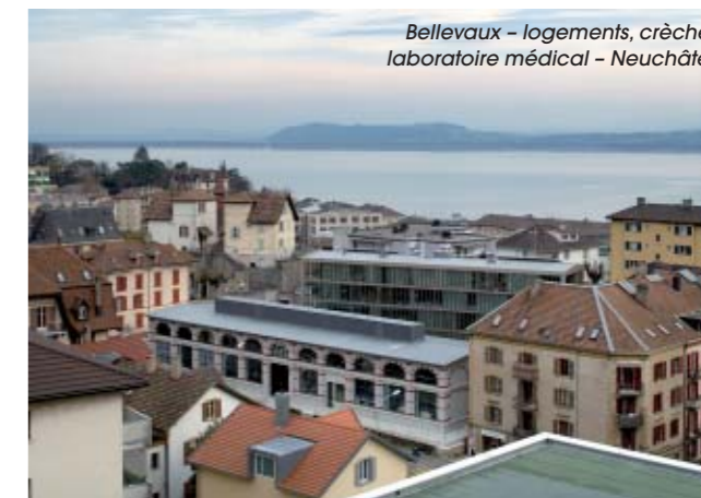
Bellevaux – logements, crèche, laboratoire médical – Neuchâtel