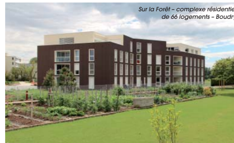
Sur la Forêt – complexe résidentiel de 66 logements – Boudry