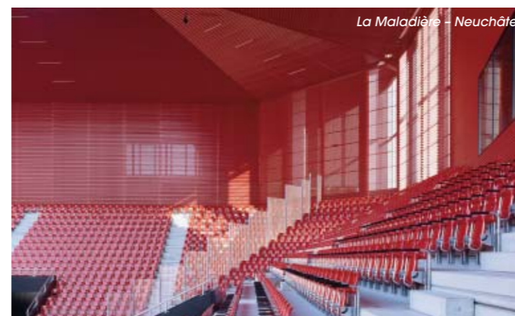
La Maladière – Neuchâtel