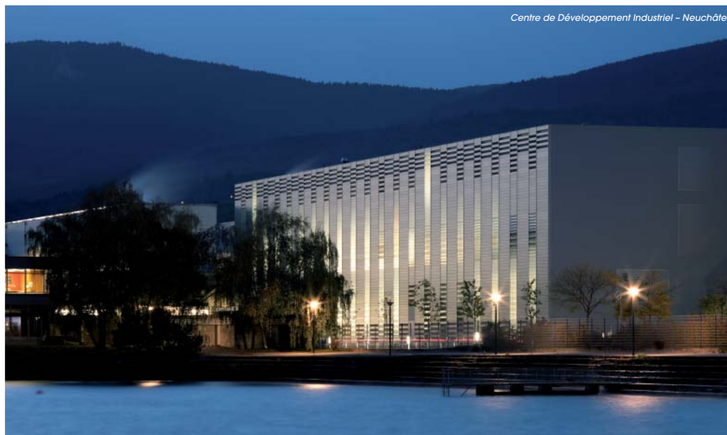
Centre de Développement Industriel – Neuchâtel

Le verre affiche ainsi le côté institutionnel et public tandis que les façades bois le dénoncent. Cette ambiguïté permet à la fois d'intégrer le bâtiment et d'affirmer son rôle social.