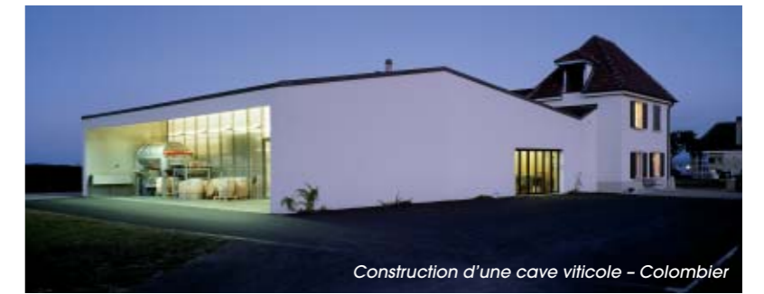
Construction d'une cave viticole – Colombier