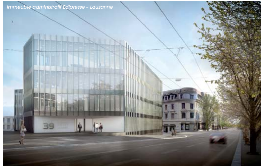
Immeuble administratif Edipresse – Lausanne